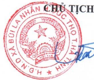
Dương Đức Đồng